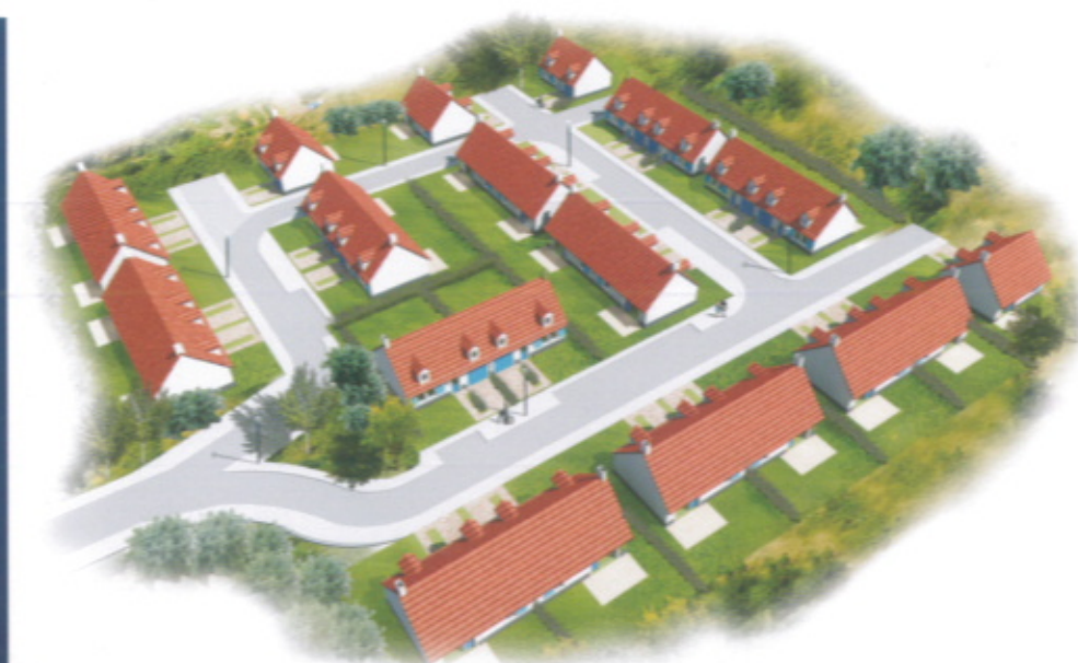
Audinghen - Plan de masse